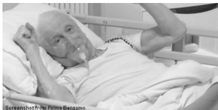
Screenshot from Prima Bergamo

duhovnik, ki je umrl zaradi koronavirusa